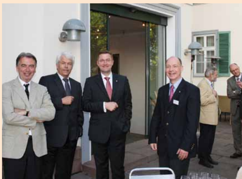
Entspannte Atmosphäre: Die Kombination aus exklusivem Ambiente und Fachvortrag gefiel den Teilnehmenden