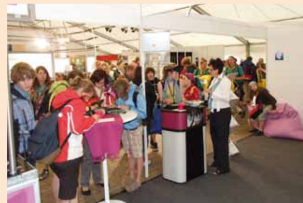
Reger Andrang am EKK-Kirchentagsstand in Bremen

Das Sofa und das Fotomosaik gehen als Symbole für Nachhaltigkeit und Partnerschaft auf „Roadshow“ in diverse Filialstandorte. Die erste Station ist die Filiale Kassel – hier kann man noch bis Ende des Jahres die beiden Fotowände betrachten.