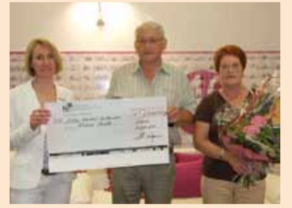
Glückliche Gewinner aus Nordhessen: Scheckübergabe in Kassel

■ Gewinnsparen ist für Kunden der EKK seit jeher eine lohnende Investition – und dies gleich mehrfach: Während von einem Gewinnsparlos monatlich 4 Euro angespart und der angesparte Betrag im Dezember des Jahres wieder ausgezahlt wird, erhalten kirchliche und diakonische Einrichtungen einen weiteren Betrag des Gewinnsparloses als Spendenbeitrag. Darüber hinaus haben EKK-Kunden durch die Teilnahme an einer monatlichen Verlosung die Möglichkeit, attraktive Preise zu gewinnen. So konnten sich in der Juni-Auslosung des Gewinnsparvereins Bayern e.V. gleich zwei Kunden der EKK über Hauptpreise freuen. Ein Ehepaar aus Mecklenburg-Vorpommern hat beim Gewinnsparen den Hauptpreis